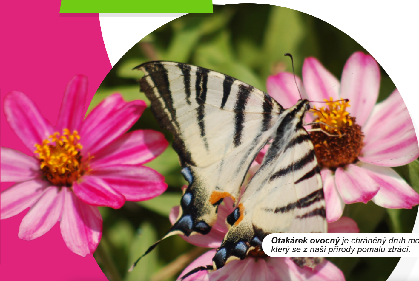
Otakárek ovocný je chráněný druh motýla, který se z naší přírody pomalu ztrácí.